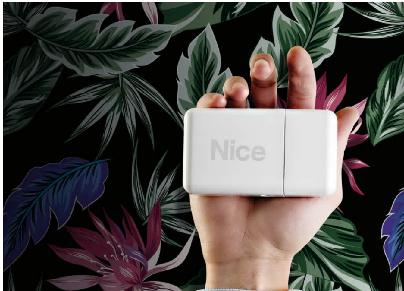
Core hub, serce systemu automatyki Yubii

Yubii to nowy ekosystem Nice stworzony zarówno z myślą o użytkownikach dopiero rozpoczynających swoją przygodę z automatyką domową, jak i dla tych, którzy chcą rozbudować swój system automatyki. Podłączając Core hub, serce systemu automatyki Yubii do domowej sieci Wi-Fi, można połączyć wszystkie elementy systemu automatyki Nice sprawiając, że będą one współdziałały.