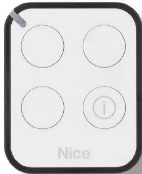
Pilot Era One BD

Ekosystem Yubii wyróżnia się na rynku rozwiązań Smart Home dwukierunkową komunikacją umożliwiającą sprawdzenie czy bramy, rolety, żaluzje zostały prawidłowo zamknięte bądź otwarte. Nice jako pierwszy producent na polskim rynku wprowadził tę możliwość, dzięki której konsumenci zyskują komfort, bezpieczeństwo i wygodę - wszystko w zasięgu pilota Era One BD .