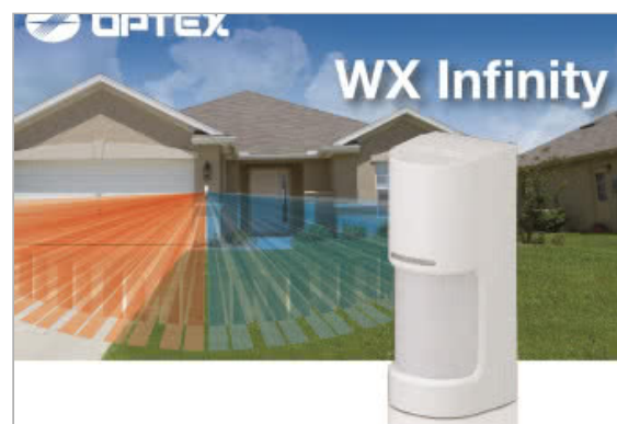
Panoramiczna czujka ruchu OPTEX WX Infinity