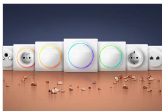
Inteligentne gniazda i włączniki FIBARO Walli dostępne w...